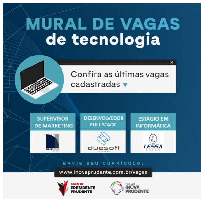
Exemplo de anúncio de vagas recentes do Mural