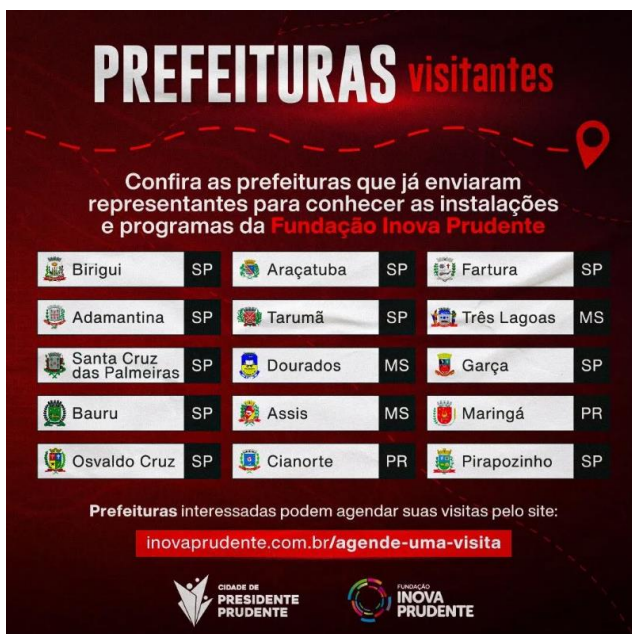
Lista de algumas das prefeituras visitantes