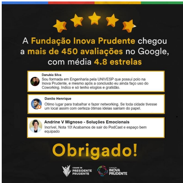
Tradicional publicação de índices de satisfação

Principal canal de comunicação das atividades da Inova alcançou em 2024 a marca de 12.000 seguidores. Abaixo está alguns exemplos de postagens feitas ao longo do ano.