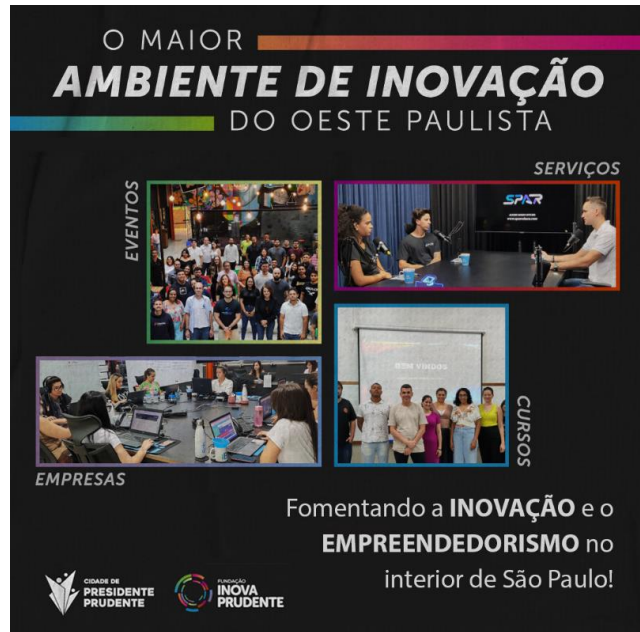
Imagem institucional de divulgação de serviços